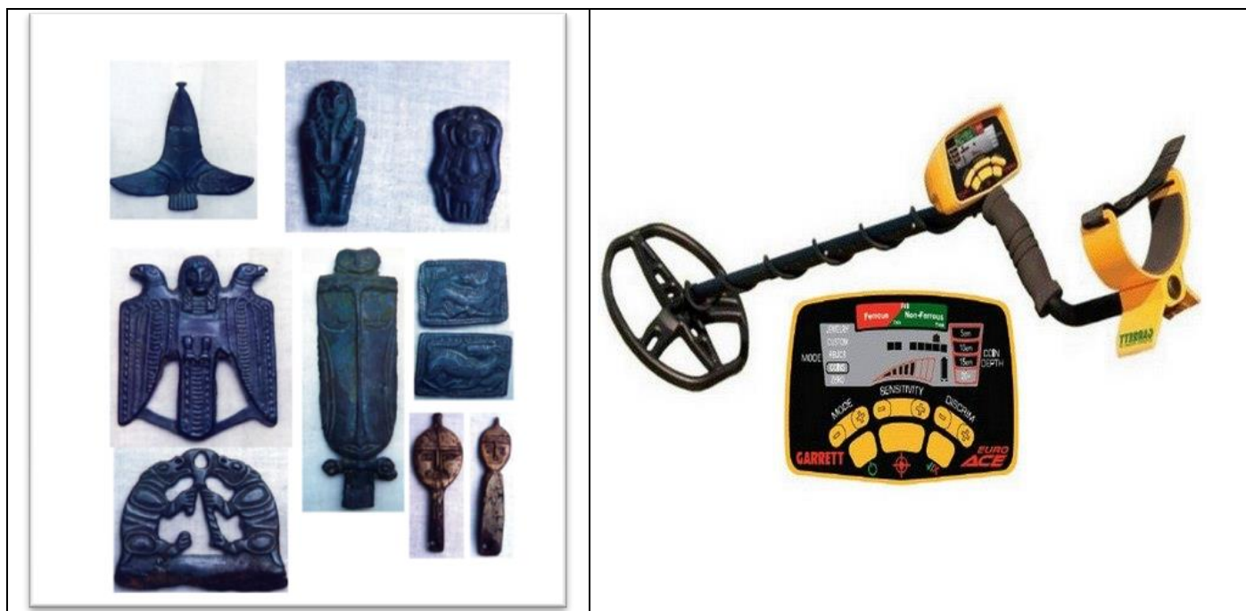
Что ищут «черные копатели»

по мнению мародеров, вещи – изделия из кости и чёрного металла, керамика. Полностью разрушаются остатки погребальных сооружений и уничтожается информация о расположении вещей, позе погребенного, различные следы ритуалов и другие материальные следы духовной культуры древних.