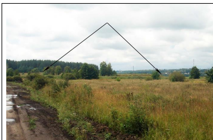
Крюково-Кузновский могильник. Моршанский район. Вид с северо-востока

Грунтовые могильники – старинные кладбища, места древних захоронений без явных признаков в рельефе.