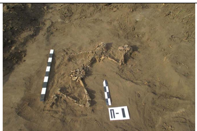
Погребение в кургане-9 Курганной группы у с. Бурнак Жердевского района.