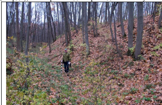
Городище-1 у с. Горелое Тамбовского района. Вид с северо-запада.

Городища – укрепленные поселения, имевшие распространение с эпохи неолита до раннего средневековья. Обычно располагаются на высоких берегах, мысах, в местах слияния рек, оврагов. На городищах всегда фиксируются остатки оборонительных сооружений в виде валов и рвов. Как правило, многие из них обладают мощным культурным слоем, хотя выделяются городища-убежища (тверди), в которых люди пережидали военную опасность, но не жили.