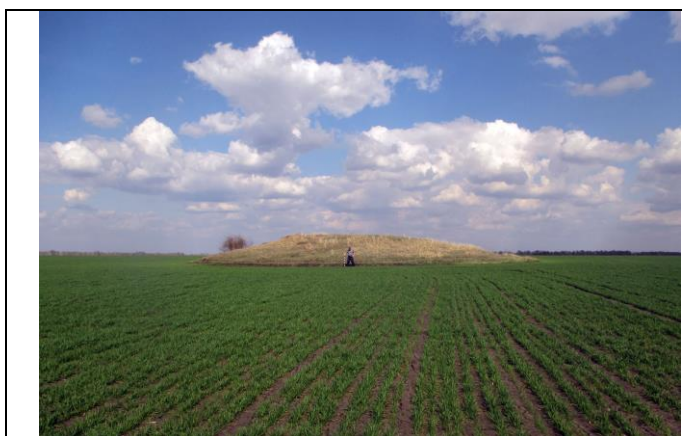
Курган у с. Хитрово Рассказовского района. Вид с юго-запада

Курганные могильники – могильники или отдельные могилы, с искусственной насыпью над могильной ямой в виде земляной насыпи – кургана.