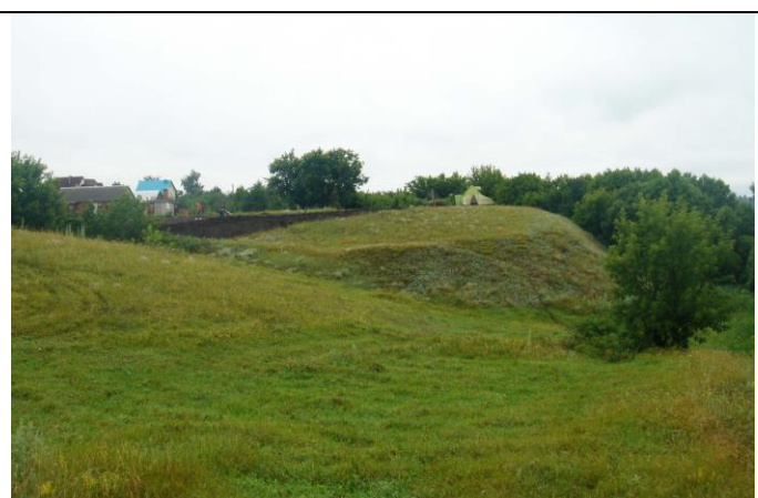
Бокинский могильник. Тамбовский район. Вид с юга.

Курганные могильники – могильники или отдельные могилы, с искусственной насыпью над могильной ямой в виде земляной насыпи – кургана.