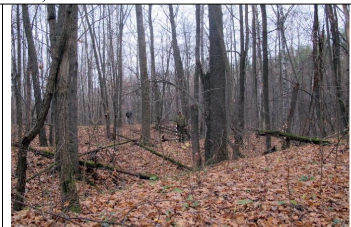
Городище-1 у с. Носины Моршанского района. Три линии укреплений. Вид с юго-востока.

Исторические города и поселения – населённые пункты, имеющие архитектурные памятники, градостроительные ансамбли и комплексы, являющиеся памятниками истории и культуры, а также сохранившиеся природные ландшафты и древний культурный слой земли, представляющий археологическую и историческую ценность. Иногда в рамках города или поселения выделяется историческая часть, подлежащая особой охране.